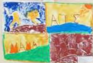
Small white label with text, likely the child's name and age.