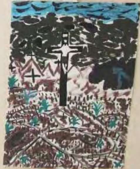
Small yellow label with illegible text.