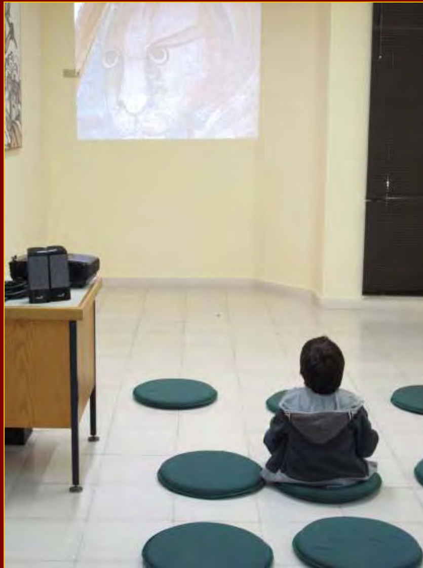
Προβολή της ταινίας του εκπαιδευτικού προγράμματος