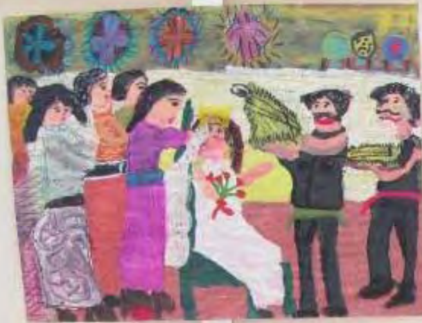
Small yellow label with text, likely the artist's name and the title of the artwork.