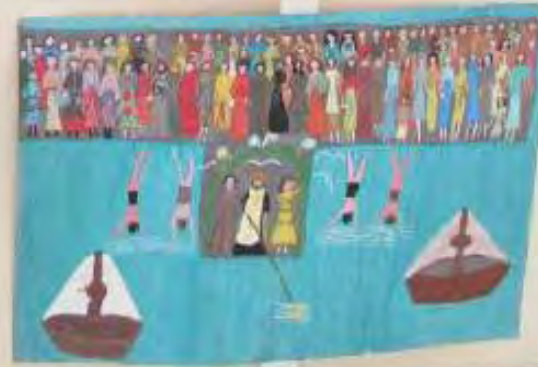
Small yellow label with text, likely the artist's name and the title of the artwork.