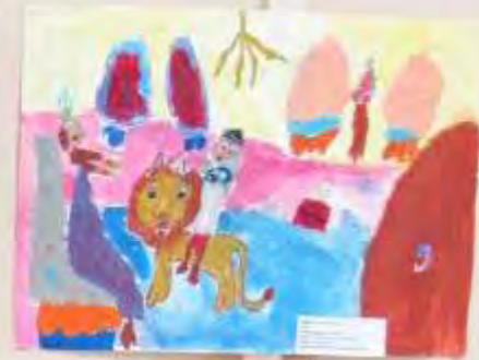
Small white label with text, likely the child's name and age.