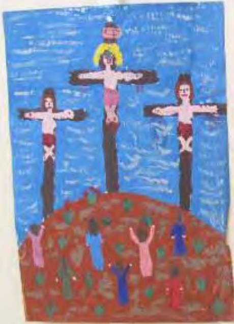
Small yellow label with illegible text.