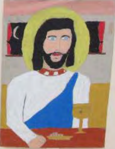
Christ the King