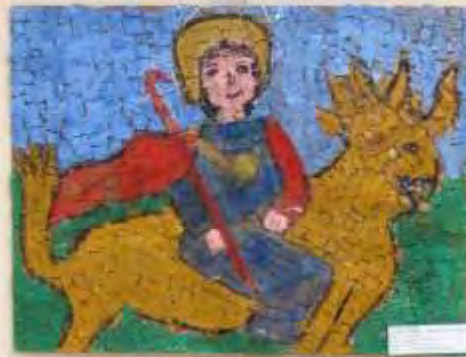
Small white label with text, likely the child's name and age.