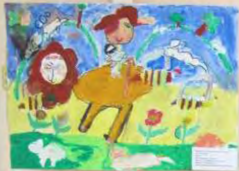
Small white label with text, likely the child's name and age.