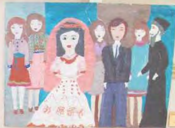
Small yellow label with text, likely the artist's name and the title of the artwork.