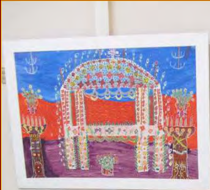
Christ the King