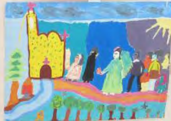
Small yellow label with text, likely the artist's name and the title of the artwork.