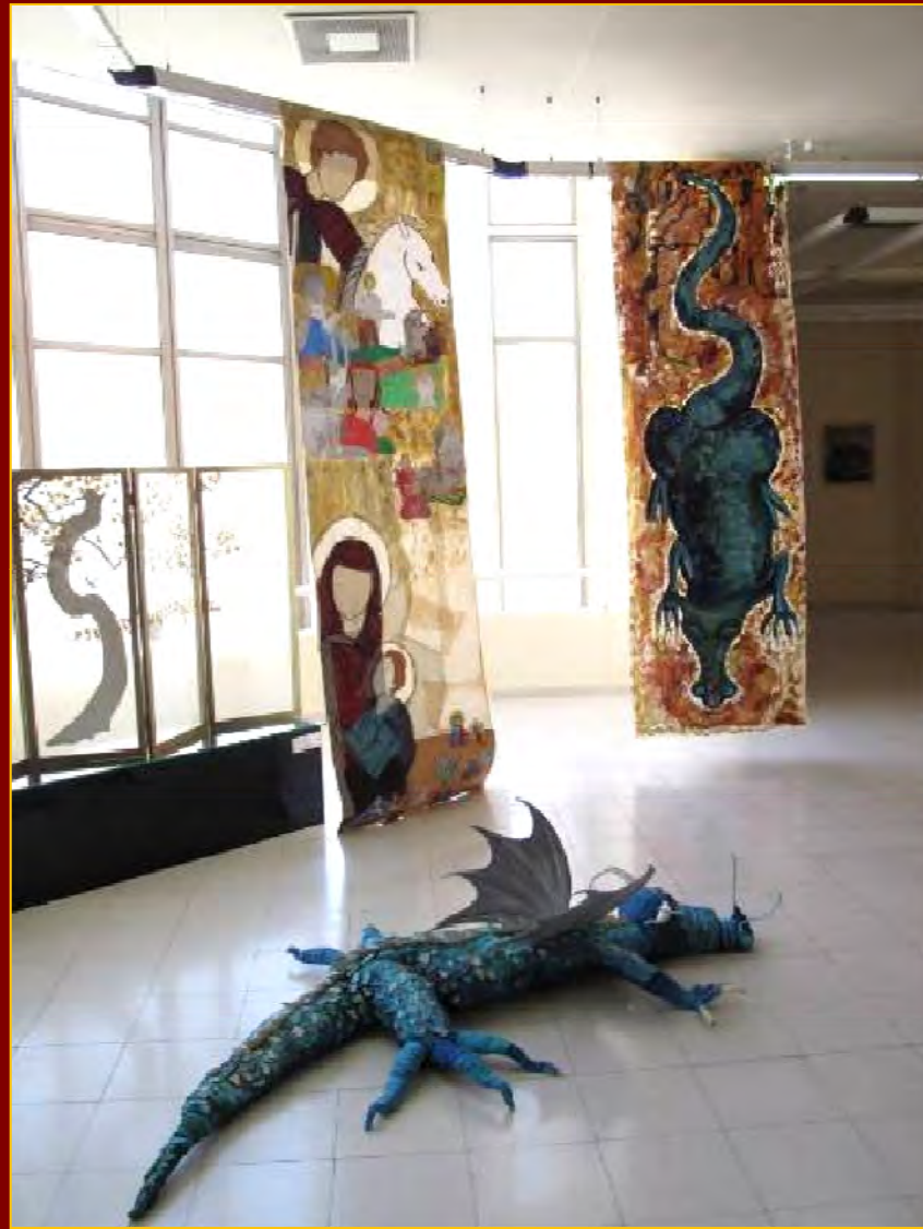
Τα σκηνικά του εικαστικού δρώμενου