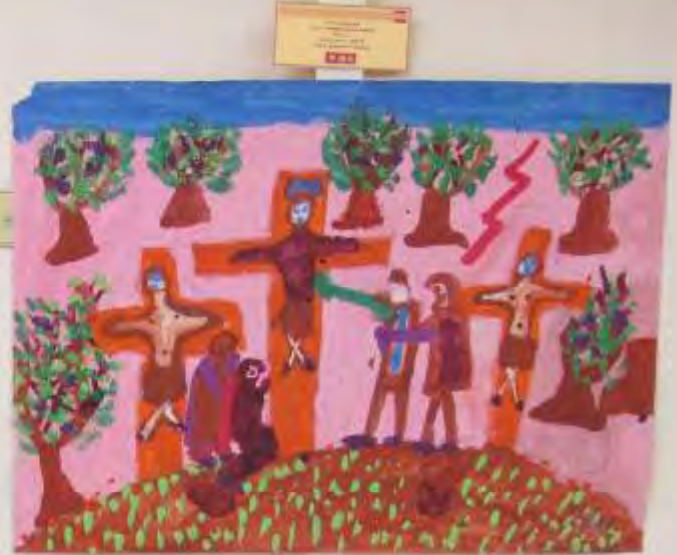
Christ the King