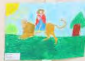
Small white label with text, likely the child's name and age.