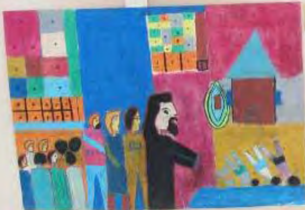
Small yellow label with text, likely the artist's name and the title of the artwork.