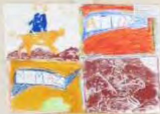
Small white label with text, likely the child's name and age.