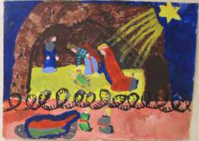
Small yellow label with illegible text.